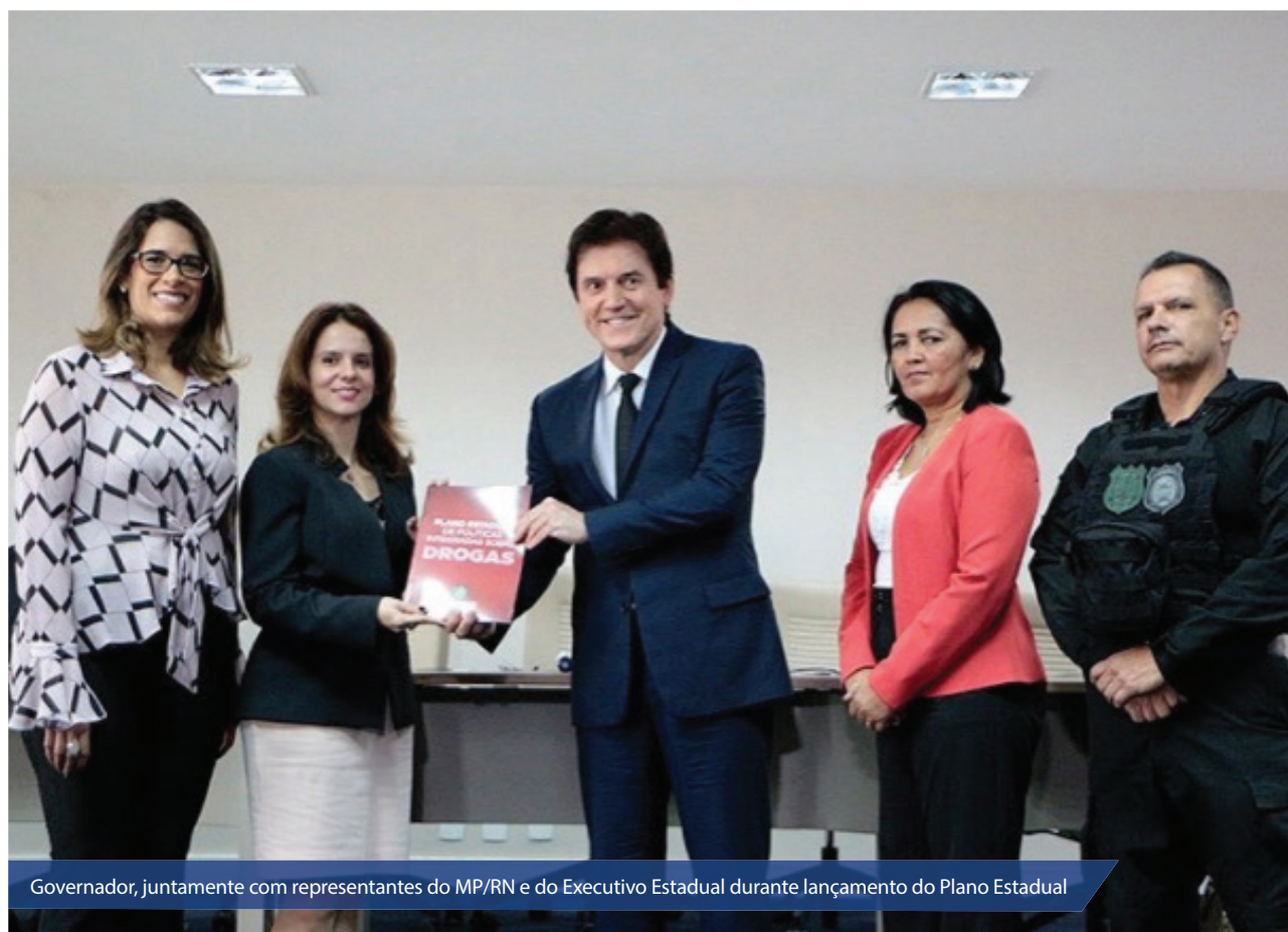
Governador, juntamente com representantes do MP/RN e do Executivo Estadual durante lançamento do Plano Estadual

O Plano prevê eixos de ação, com a prevenção, cuidado, autoridade com atuação policial preventiva, ostensiva e investigativa, gestão integrada e monitoramento