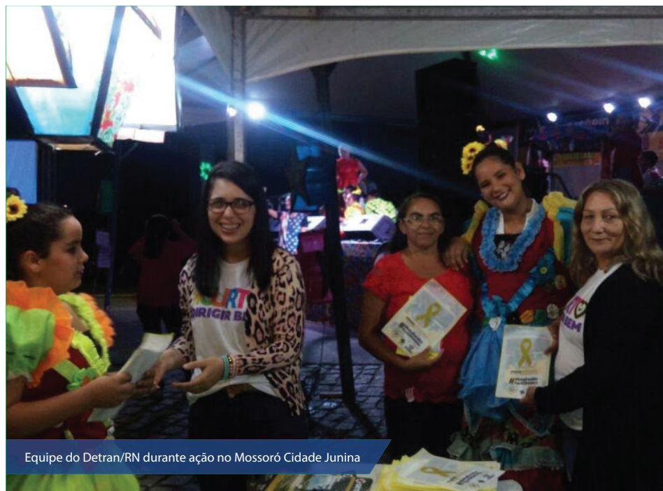
Equipe do Detran/RN durante ação no Mossoró Cidade Junina

Um equipamento que fez sucesso durante o Mossoró Cidade Junina foi o óculos de simulação de embriaguez. Nessa situação, por meio de realidade virtual, as pessoas tinham a real consciência da incapacidade de um indivíduo embriagado dirigir um automóvel