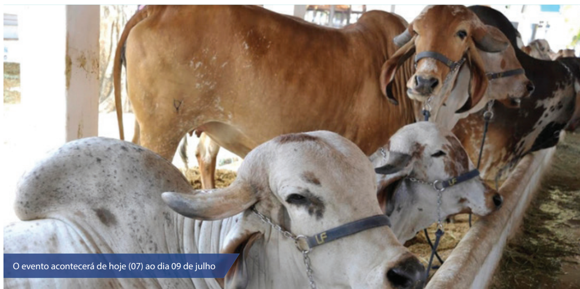
O evento acontecerá de hoje (07) ao dia 09 de julho

A feira é uma realização do Governo do Estado, e parceria entre Emater, Emparn, Prefeituras Municipais da região, ANCOC, ANORC, Secretaria Estadual de Agricultura e Pecuária, entre outros.